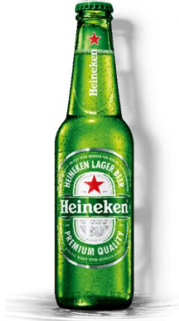
Heineken sticla 0.33l