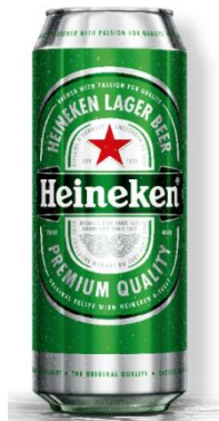
Heineken doza 0.5l